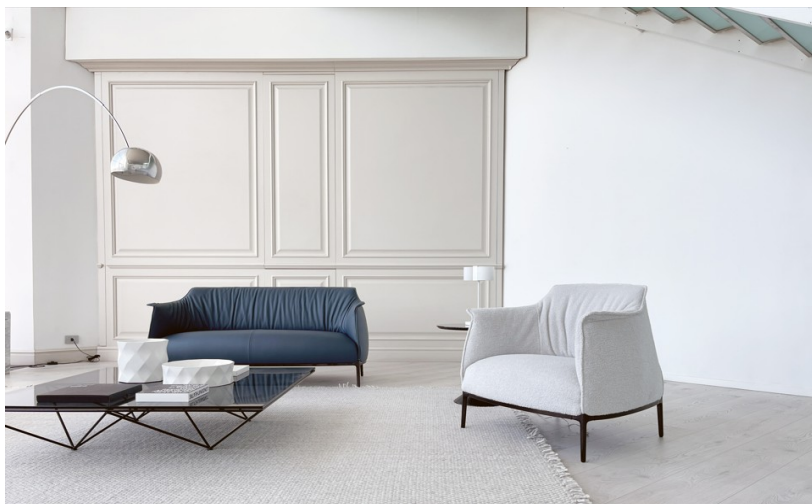
Foto campione / Immagini di riferimento (Foto puramente indicative)