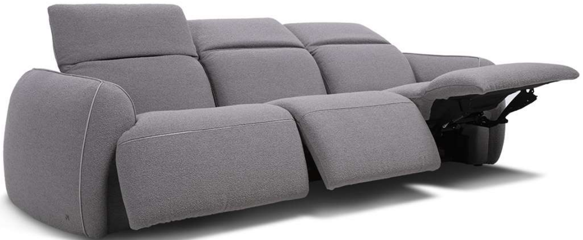
■ Vers. Q00+Q25+Q02