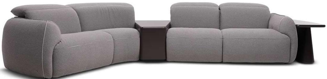
■ Vers. Q00+045+823+Q25+817