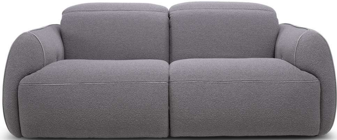
■ Vers. Q00+Q02