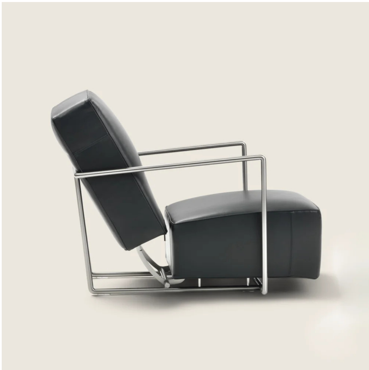
A.B.C. ANTONIO CITTERIO 1996 FAUTEUILS