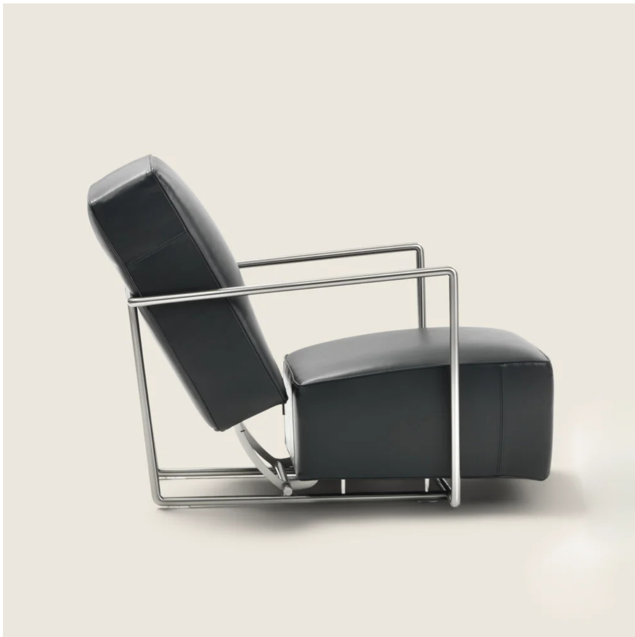
A.B.C. ANTONIO CITTERIO 1996 POLTRONE