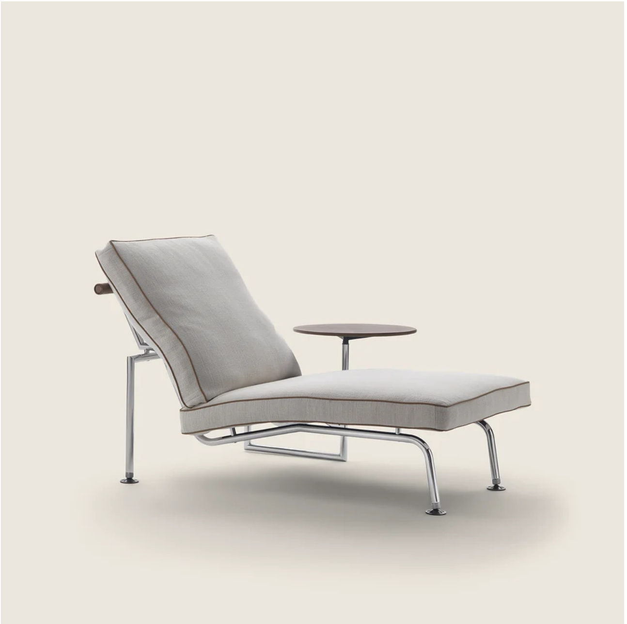
GINGER ANTONIO CITTERIO 1984 CHAISE LONGUE/DORMEUSE