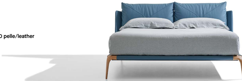
Teda 160 pelle/leather