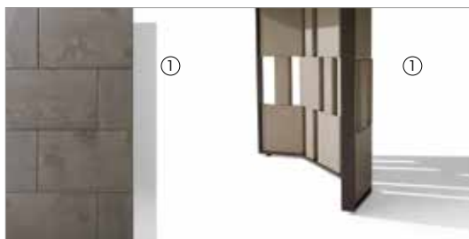
1 Break 88250 fin. 3F