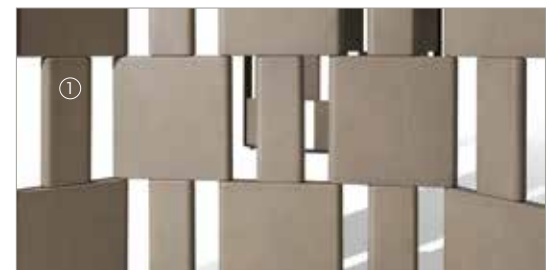
1 Break 88250 fin. 3F