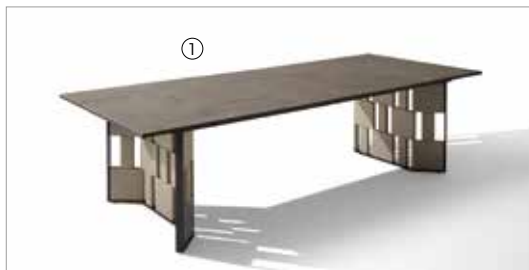
1 Break 88250 fin. 3F