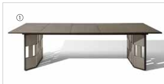
1 Break 88250 fin. 3F