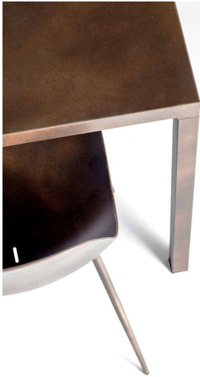
bronzo / bronze