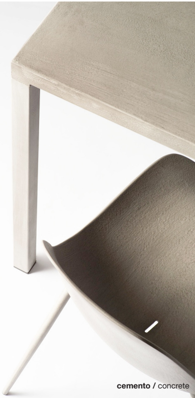
cemento / concrete