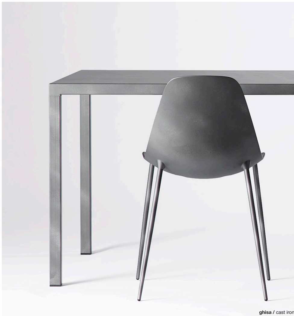
ghisa / cast iron