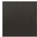
FERRO LACCATO EFFETTO "IRONDUST"