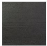
FERRO NATURALE LACCATO TRASPARENTE OPACO