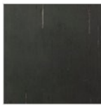
FERRO NATURALE, FINITURA A OLIO (VERSIONE STANDARD)