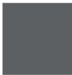
RAL 7037 GRIGIO POLVERE