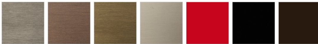
EFFETTO TITANIO SPAZZOLATO OPACO