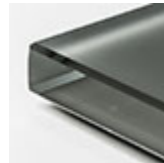
graphite extra chiaro acidato