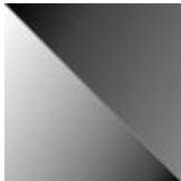
bianco extra chiaro