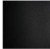
GFM73 goffrato nero