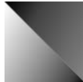
graphite extra chiaro