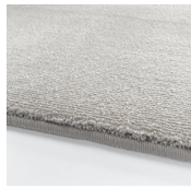
Simply White Simply White