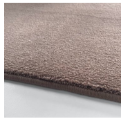
Tea Rose Amazing Grey