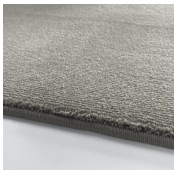
Amazing Grey Tea Rose