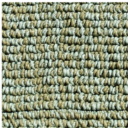
O Sole Mio Sabbia