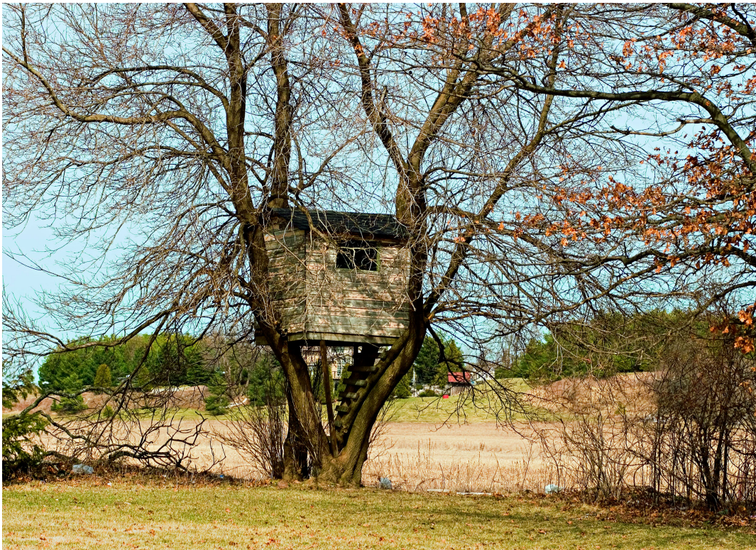
Tecnologia naturale Natural technology