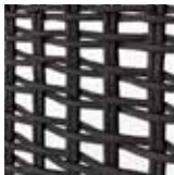
intreccio - weave CHECKED