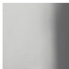
Metallo cromato lucido