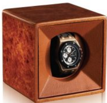
3901 TEMPO UNICO RADICA

Rotore per orologio automatico in radica lucida. Rivestito in pelle , meccanica di fabbricazione Svizzera con accensione a sfioramento, funzionamento a pile.