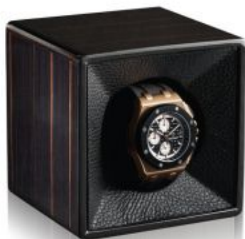
3601 TEMPO UNICO EBANO

Rotore per orologio automatico in ebano lucido. Rivestito in pelle, meccanica di fabbricazione Svizzera con accensione a sfioramento, funzionamento a pile.