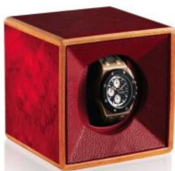
3501 TEMPO UNICO ROSSO

Rotore per orologio automatico in radica rossa lucida. Rivestito in pelle, meccanica di fabbricazione Svizzera con accensione a sfioramento, funzionamento a pile.