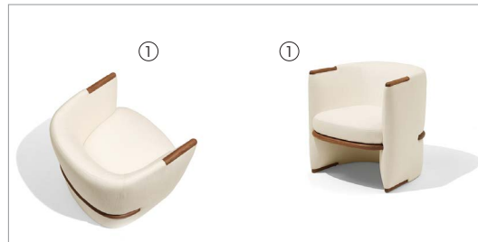
1 Opus 77100 penny 6704 fin. 11