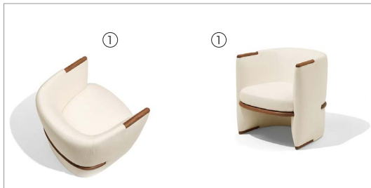
1 Opus 77100 penny 6704 fin. 11