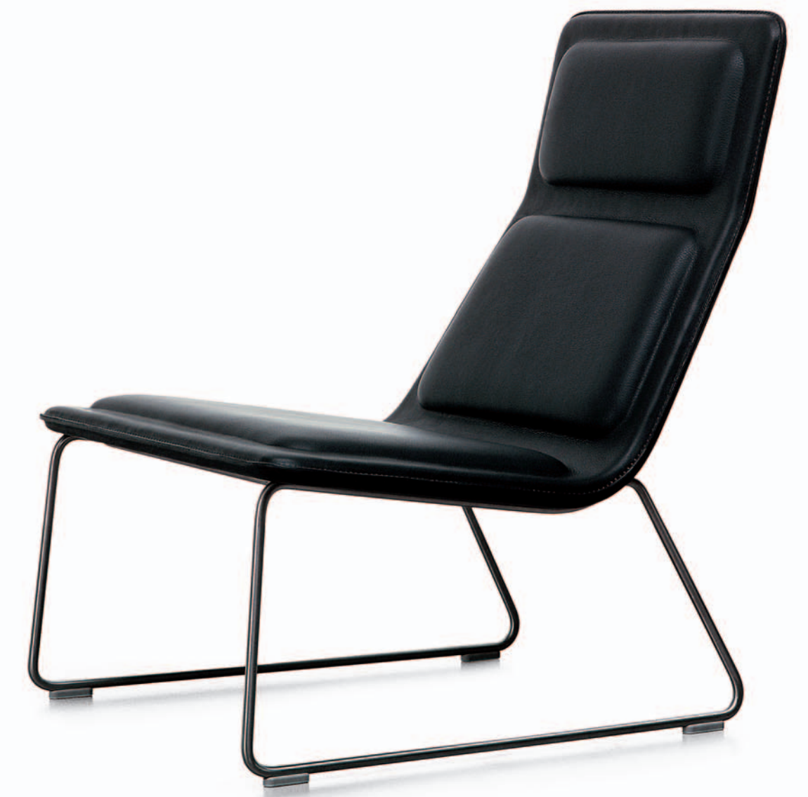
LOW PAD Jasper Morrison 1999/2002