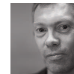
by L. Gullerup

Geboren 1959 in London, Universitätsabschluss am Royal College of Art, 1986 Eröffnung seines ersten Studios. Unmittelbar danach beginnt eine lange und interessante Zusammenarbeit, die ihn mit Cappellini verbindet; heute arbeitet er zwischen London und Paris für wichtige Firmen wie Alessi, Flos, Rowenta, Sony und Samsung. Jedes seiner Projekte weist eine minimalistische Eleganz auf, die ihm extreme Modernität verleiht, obwohl es sich um eine Art essentielle, mit der Vergangenheit verbundene Urform handelt, und die Funktion der Ausdruckskraft stets vorangestellt wird.