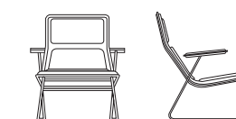
LW/2 cm. 74,5x70,5x35/75h. inch 29,25x27,75x13,75/29,50h.

Poltroncina con o senza braccioli, scocca in multistrato di legno imbottita in poliuretano espanso a quote differenziate. Rivestimento fisso nei tessuti e pelli di collezione. Gambe in acciaio inox satinato, piedini in gomma.