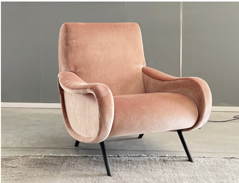
Foto campione / Immagini di riferimento (Foto puramente indicative)