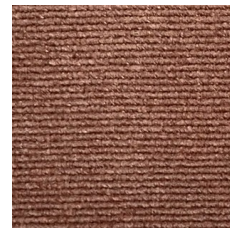
Tessuto rosa antico