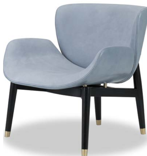
Kashmir Azure | Tuscany Punta Ala

Struttura schienale in legno multistrato di betulla. Imbottitura in poliuretano espanso a densità differenziata con rivestimento in fibra acrilica. Basamento in frassino tinto wengé. Puntale del piedino in ottone satinato, in metallo brunito spazzolato a mano o in metallo nichelato satinato, con vernice opaca.