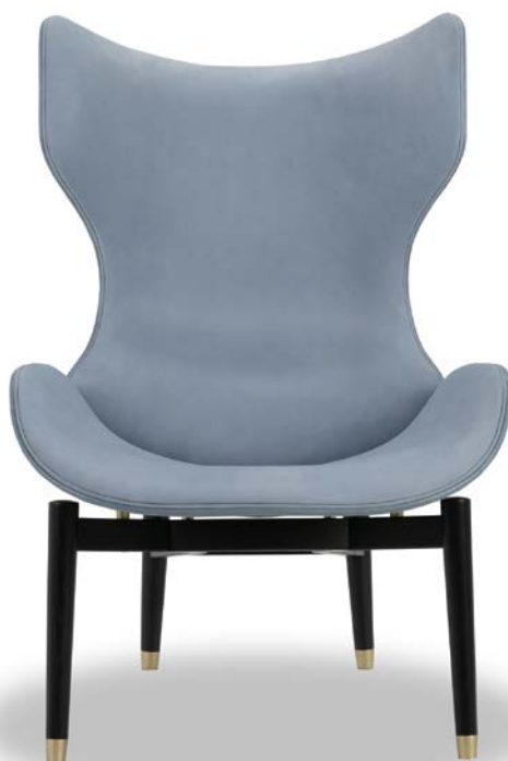
Kashmir Azure | Tuscany Punta Ala