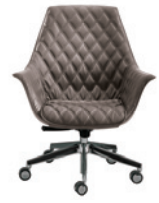
Imbottitura "romboidale" "Rhomboidal" pad

... raffinato design per l'ufficio presidenziale.