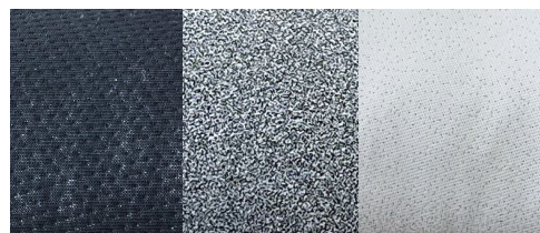
Combinazione di tessuti (grigio scuro, grigio e bianco sporco)