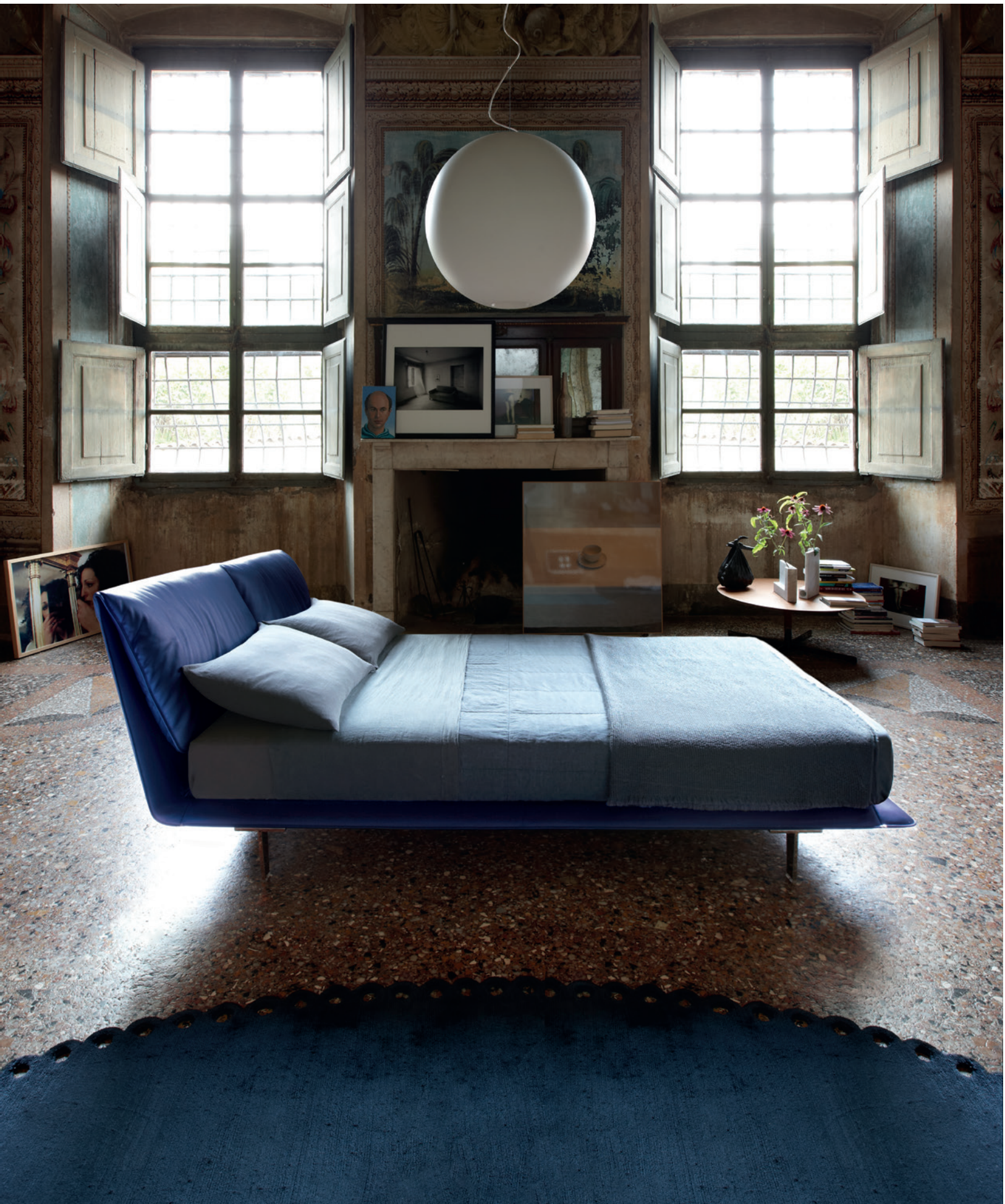
▲ John-John Bed Pelle Frau® SC 238 Blu notte. Bob table d80 h32 gunmetal grey finished steel structure and Canaletto walnut veneer (29) top.