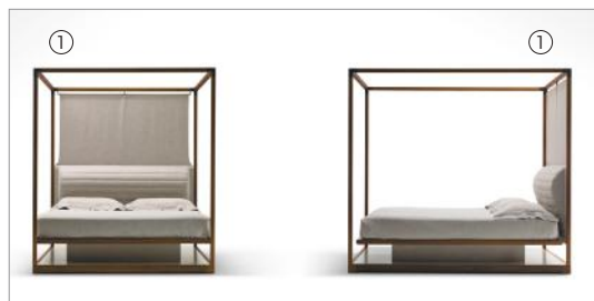
1 Ira 54270 dundee 6001 fin.11