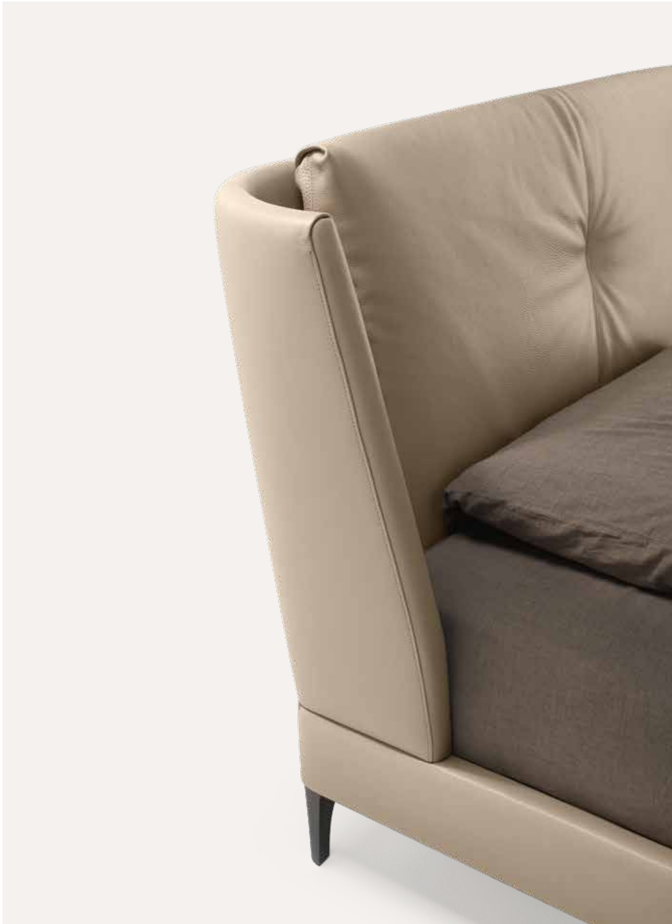
↑ Bretagne Bed, Pelle Frau® Nest Madreperla ↗ Pelle Frau® Nest Madreperla / Fabric Damiè 011