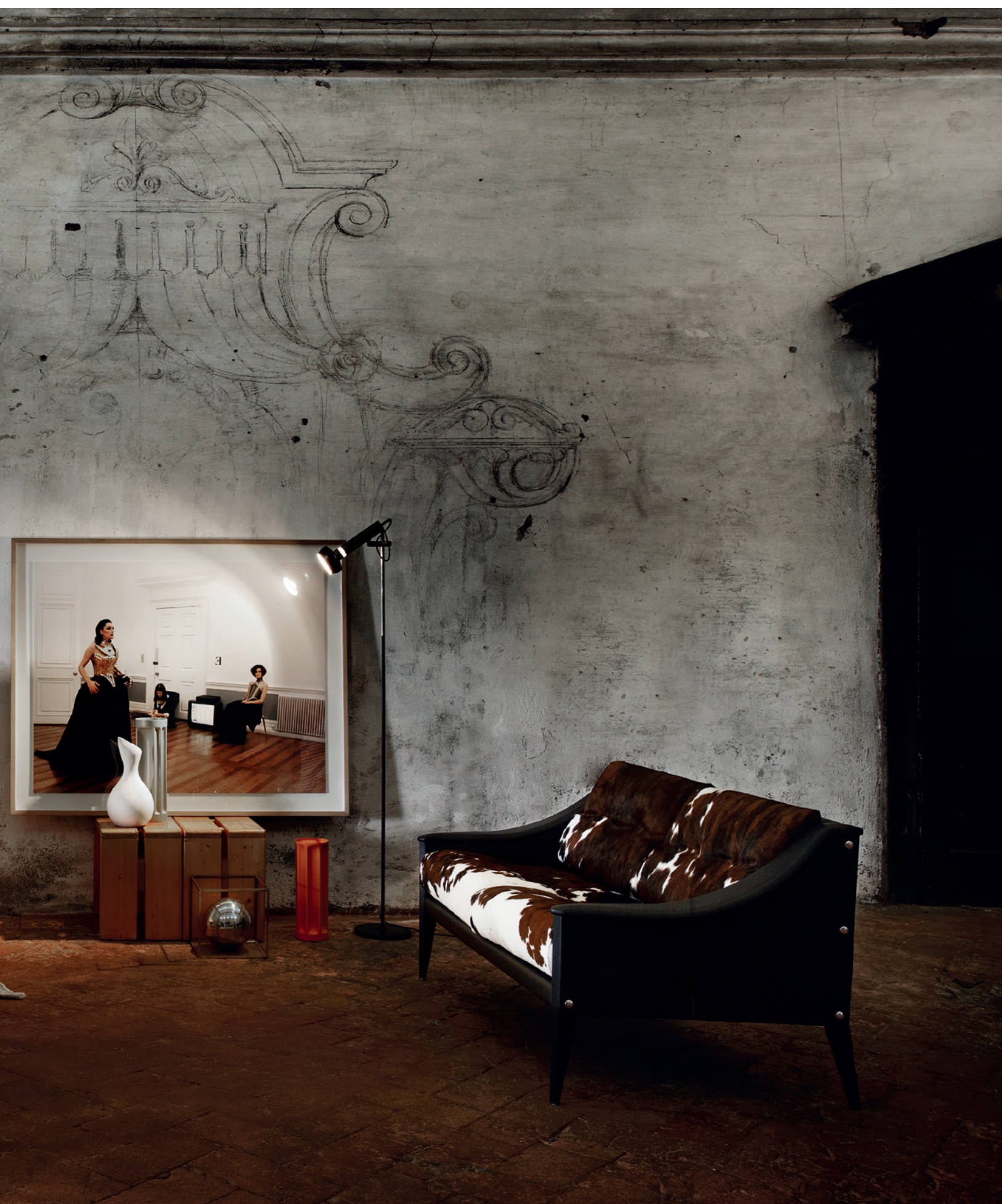
▲ Aurora Due bed Pelle Frau® SC 0 Polare. Dezza sofa 24 Pelle Frau®SC 20 Inchiostro + Pelle Frau® Cavallino.