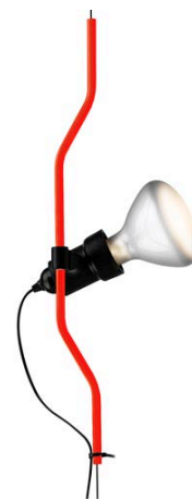
F5500035 Parentesi elemento complemento - Rosso