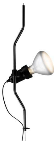
F5500030 Parentesi elemento complemento - Nero