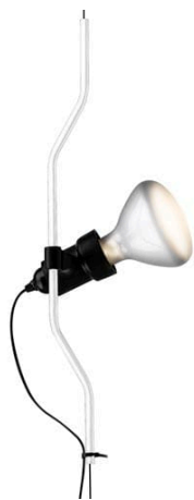
F5500009 Parentesi elemento complemento - Bianco

di Achille Castiglioni & Pio Manzù , 1971