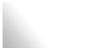
Alluminio spazzolato lucido