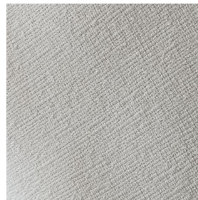
Tessuto bianco sporco