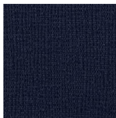
Tessuto blu notte