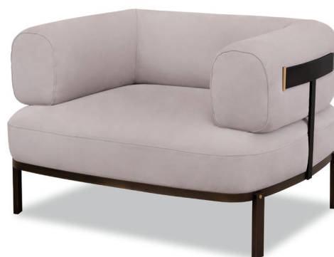
Kashmir Lilas | s. Heritage Lilla

Struttura in metallo verniciato bronzo patinato. Struttura seduta e schienale in multistrato di betulla. Imbottitura in poliuretano espanso a densità differenziata con rivestimento in fibra acrilica. Cintura posteriore con parte centrale rivestita in pelle e fermi terminali in ottone satinato. Cuscineria di seduta e schienale disponibili solo in pelli morbide. ⚡ Cintura posteriore disponibile in tutte le pelli previste dal catalogo.