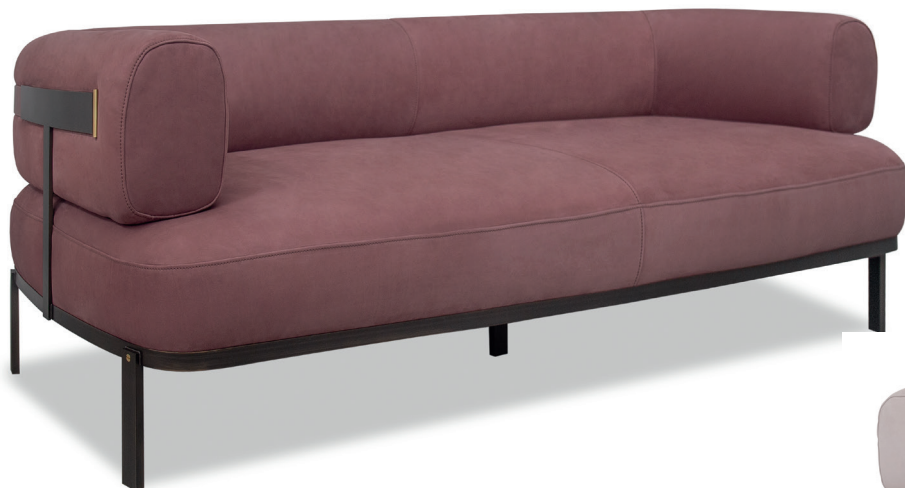
235 x 91 | Kashmir Vin | s. Polish Grape