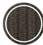
Coloniale twisted (08)