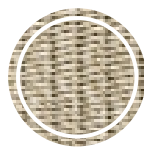
Coloniale twisted (09)

Diametro: 175 cm Altezza: 90 cm Peso: 35 Kg Volume: 2 m3 Altezza seduta: 27 cm