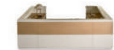
L340 P275 H109