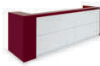
L360 P75 H109