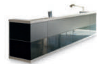
L460 P75 H109