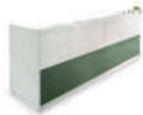
L320 P75 H109