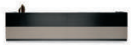
L460 P75 H109

Possible options/Anbaukompositionen/Combinaisons/Composiciones